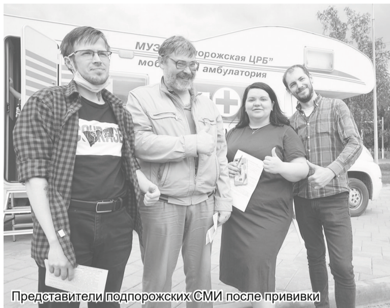
Представители подпорожских СМИ после прививки

12 июня коллективы редакции газеты «Свирские огни» и телеканала «СвирьИнфо» привились от коронавируса. Это решение далось нам, честно скажу, не легко. Мы, как и многие, долго боролись с предубеждениями, накручивали себя из-за сплетен и разрозненной информации от «диванных» экспертов.