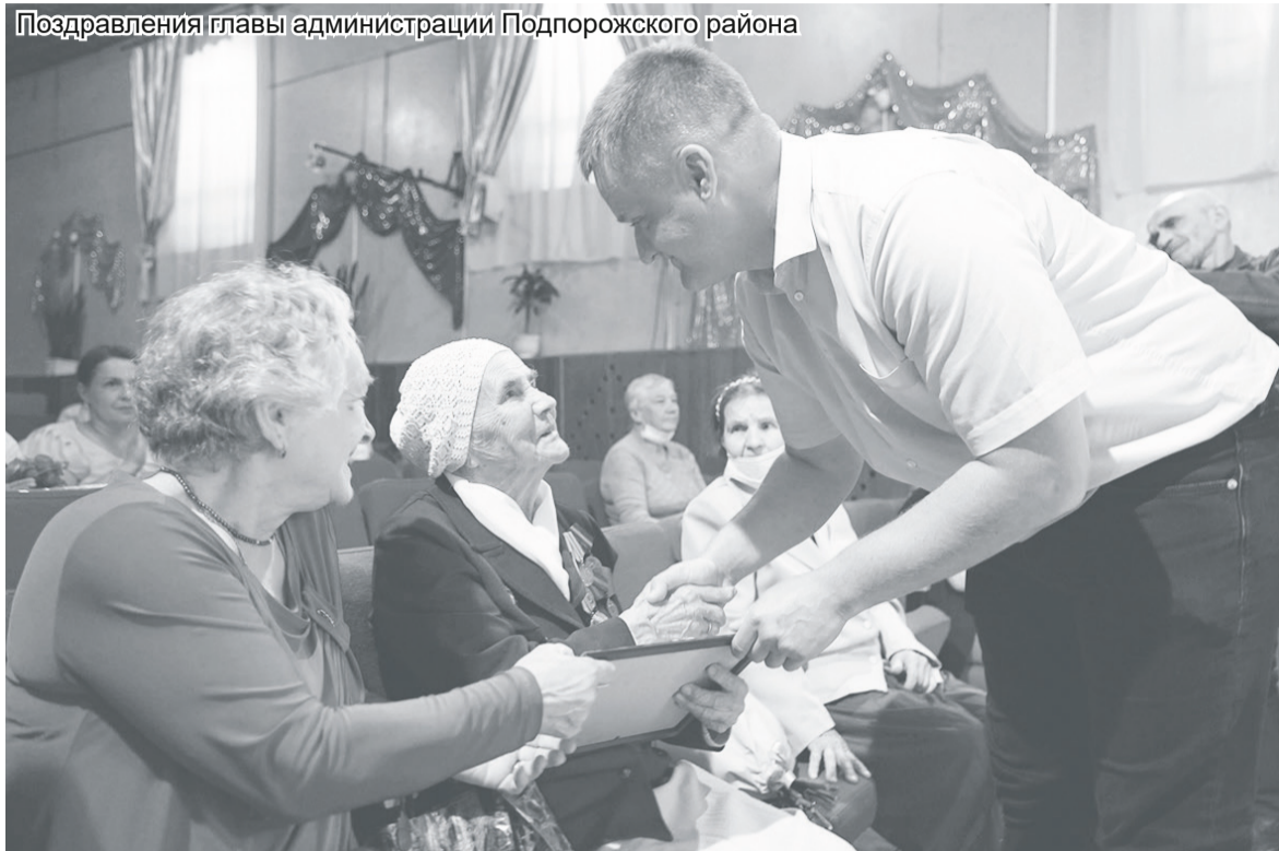
Поздравления главы администрации Подпорожского района