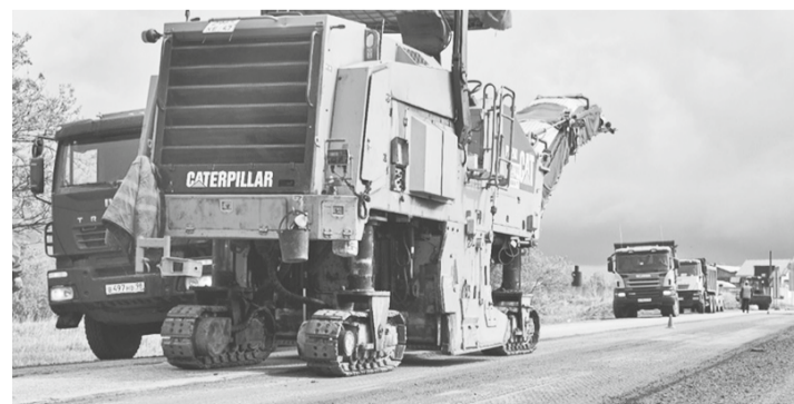
Дорожные работы на региональной трассе Лодейное Поле — Тихвин — Будогощь в Тихвинском районе