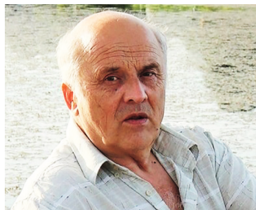
Автор текста: Михаил Курилов, краевед