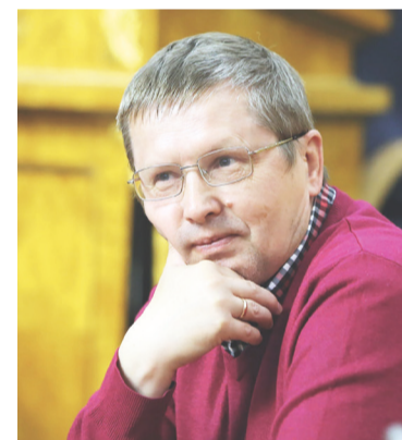
Автор текста и фото: Пётр Васильев, журналист, краевед, писатель

Так и живёт там, где началась в год её рождения знаменитая