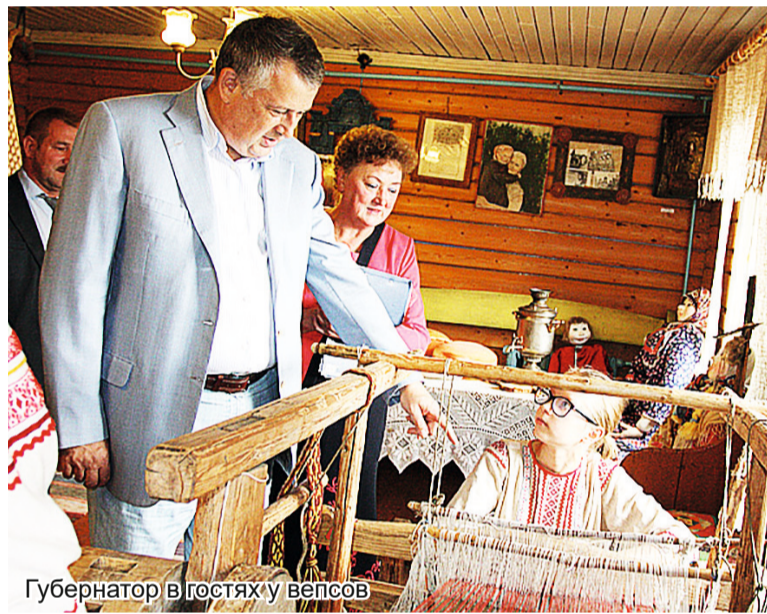
Губернатор в гостях у вепсов

В один из визитов в Присвирье губернатор Ленинградской области Александр Юрьевич Дрозденко поделился своим отношением к вепскому народу и его традициям: