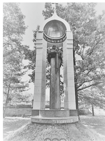
Часовня в память Невской битвы в Усть-Ижоре

В первом же столкновении русские смяли строй шведов. Нескольким смельчакам удалось проникнуть в центр вражеского лагеря, подсесть опору главного шатра, и тот упал. Это подорвало дух противника, и началось бегство. Пророческими оказались слова Александра: «Не в силе Бог, а в правде!»