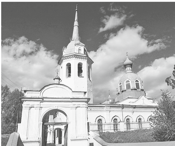
Монастырь в Новой Ладоге